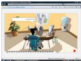
Collegamentoneuro.it è il nuovo